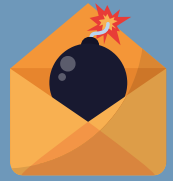
Cyberattaques avec ransomware dans le monde