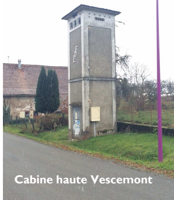
Cabine haute Vescemont

Tous ces éléments ont incité le Président du SIAGEP à trouver un accord financier avec ERDF pour résorber le plus de cabines hautes et de postes H6I possibles.